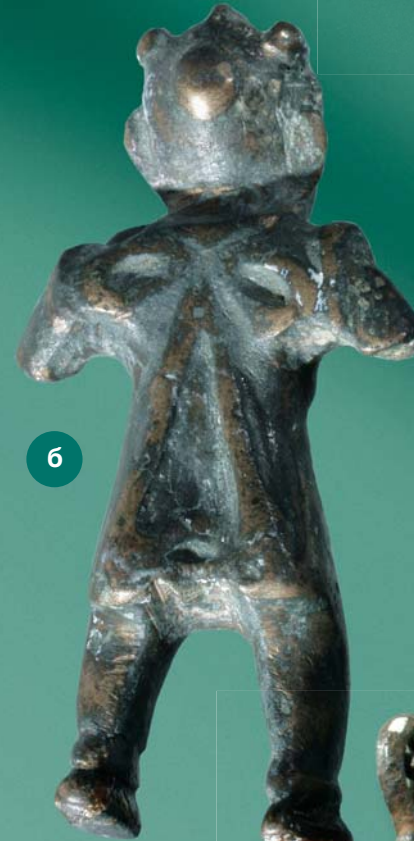
Бронзовая фигурка служителя религиозного культа — шамана — с обломанными руками, с двумя поясами (над животом и на бедрах); а — вид спереди; б — вид сзади, на спине — бант со свисающими вниз лентами. Высота 6,3 см