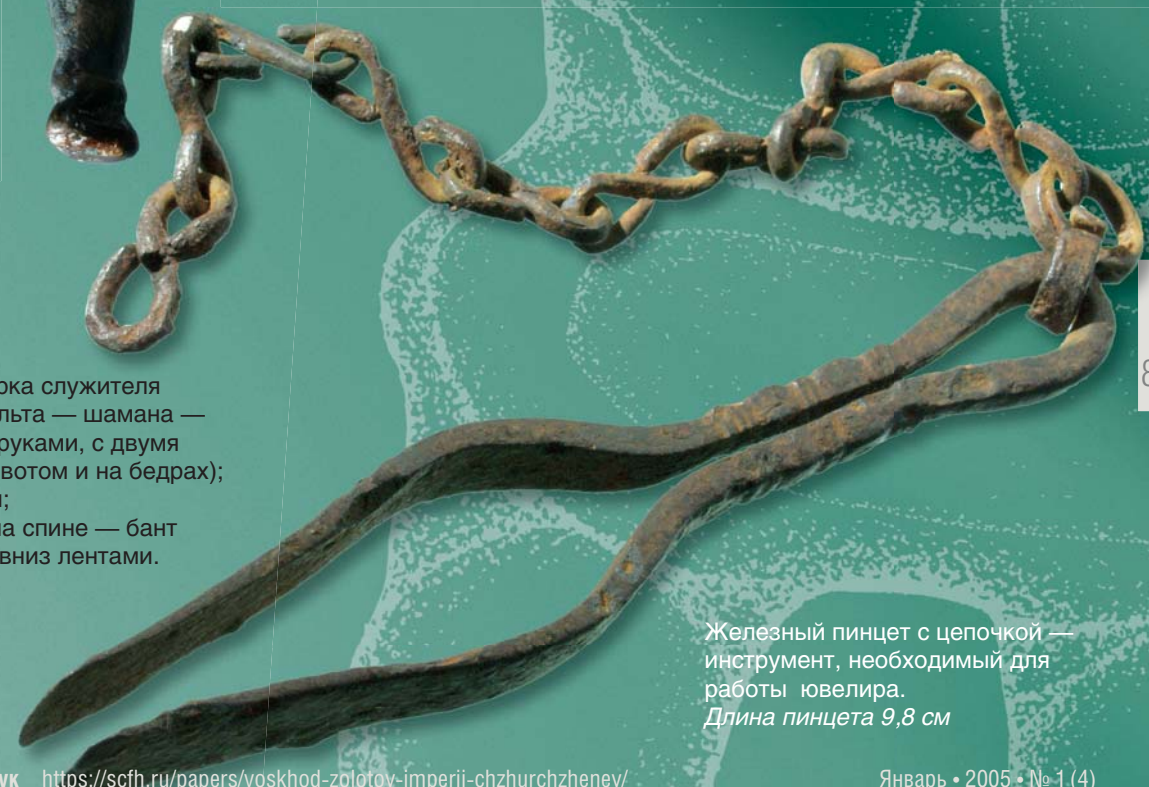
Железный пинцет с цепочкой — инструмент, необходимый для работы ювелира. Длина пинцета 9,8 см