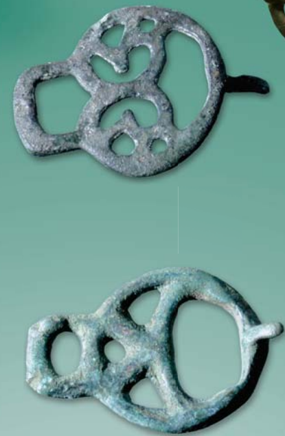
Пряжки для одежды (главным образом от поясов и обуви), отлитые в бронзе, зачастую имели самые причудливые формы. Длина 4,4 см и 4,3 см