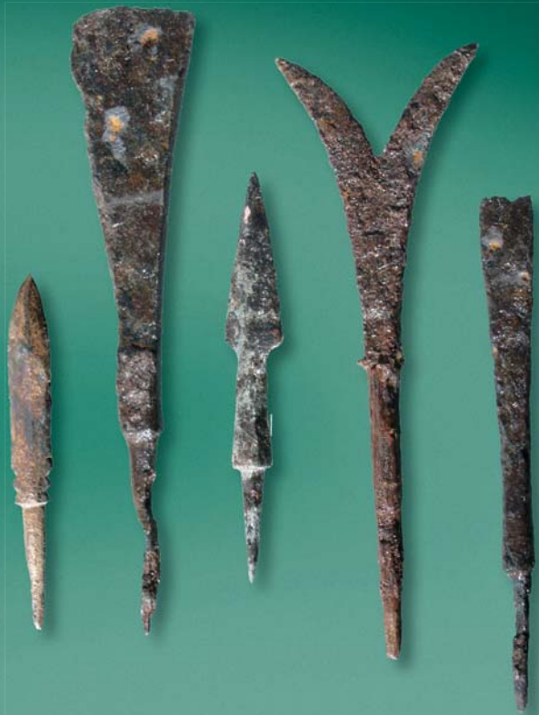
Железные наконечники стрел разной формы. Всего найдено более 40 разновидностей. Воинственные чжурчжэни обладали разнообразным наступательным и защитным вооружением. Лук со стрелами использовался не только в боевых целях, но также для охоты. Длина от 7,1 до 12,4 см