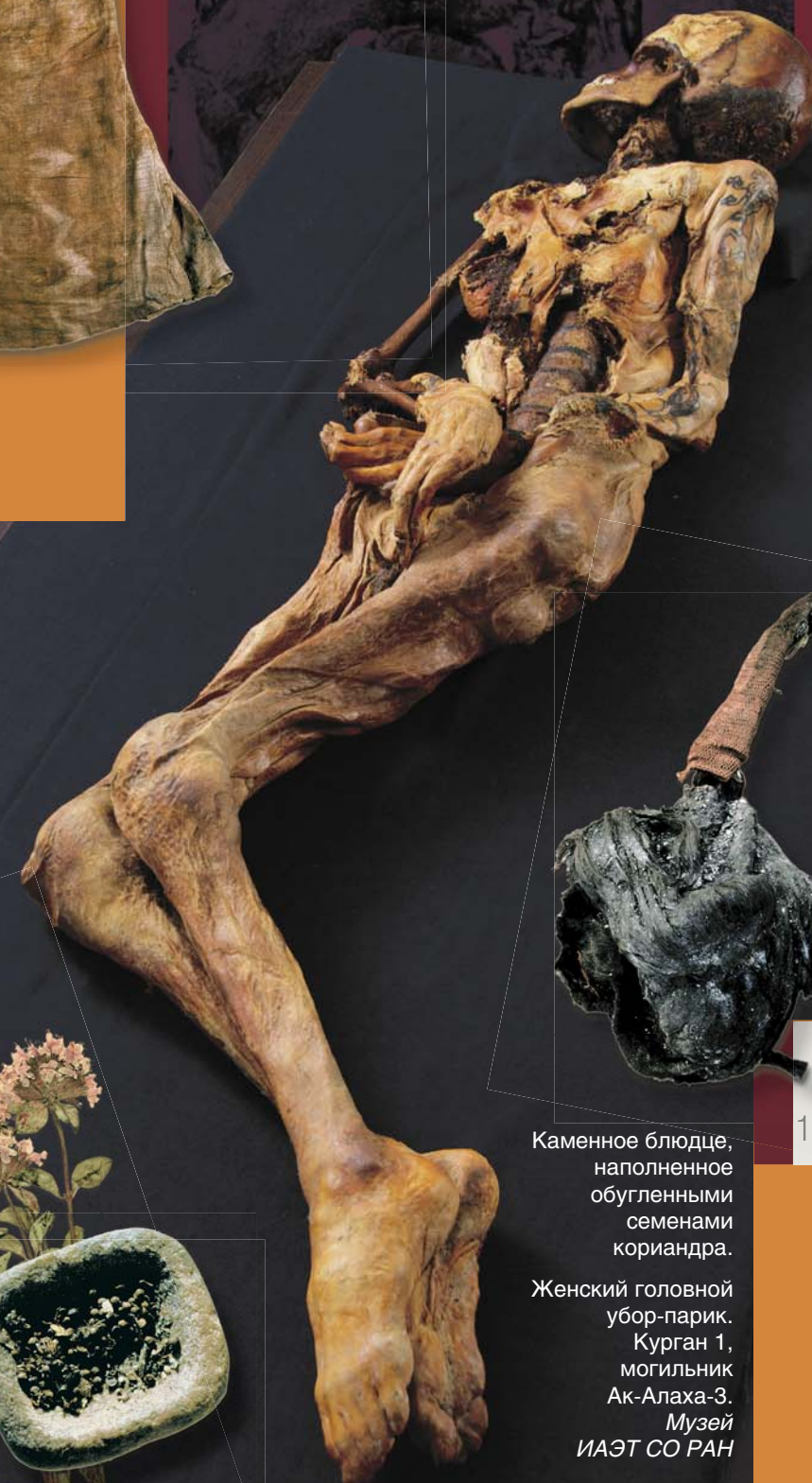
Каменное блюдо, наполненное обугленными семенами кориандра.

...Наличие плотных узлов в правом аксиллярном пространстве и узла в правой молочной железе указывают на прижизненный процесс, распространявшийся от центра на периферию <...> В патологоанатомическом плане можно предположить, что мы имеем дело с тканями, обладающими аномальными свойствами; наиболее вероятно – с первичной опухолью в правой молочной железе и с лимфатическими узлами, пораженными опухолевыми метастазами