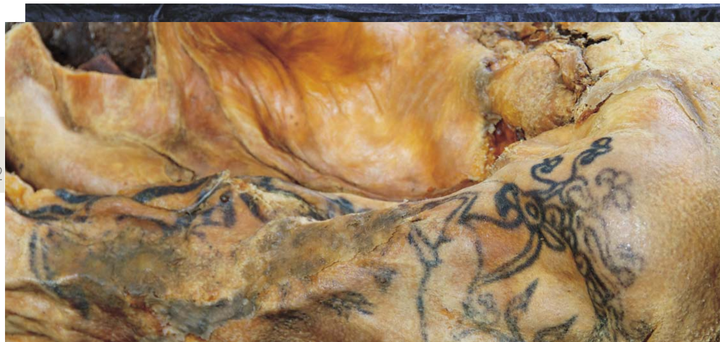
Фрагмент войлочного покрытия седла. Татуировка на плече и руках мумии женщины. Аппликация из кожи, украшавшая стенки колоды. Курган 1, могильник Ак-Алаха-3. Музей ИАЭТ СО РАН

Изменения правого тазобедренного сустава носят прижизненный характер. В сочетании с травматической деформацией головки правой плечевой кости и деформацией передней крестообразной связки правого коленного сустава и деформации по типу сублистеза в поясничном отделе позвоночника они дают основания предположить значительную прижизненную травму. Это могло произойти при падении с лошади