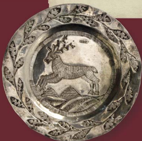
Блюдце с изображением оленя. Тобольск, первая четверть XIX в. Серебро. Диаметр 10 см. Клейма мастера: П-Б (два: наложено одно на другое) Музей ИАЭТ СО РАН

издержки на которую взял на себя губернатор Гагарин. В этой мастерской делались серебряные сервизы и другие драгоценные вещи. Со временем некоторые из пленных сами устроили мастерские.