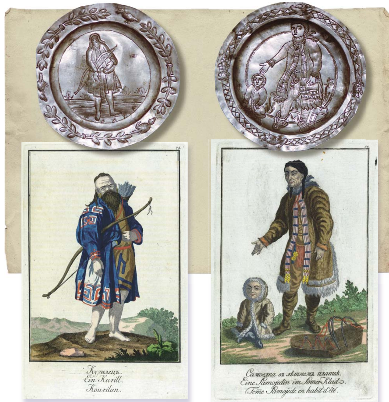
Блюдце с изображением мужчины с луком в руках. Предположительно Тобольск, первая четверть XIX в. Серебро, 916 проба, вес – 29,25 г. Диаметр – 11,2 см. Клеймо мастера: П.Б. МАЭ РАН

В качестве еще одного аргумента за тобольское происхождение двух блюдцев из Кунсткамеры можно