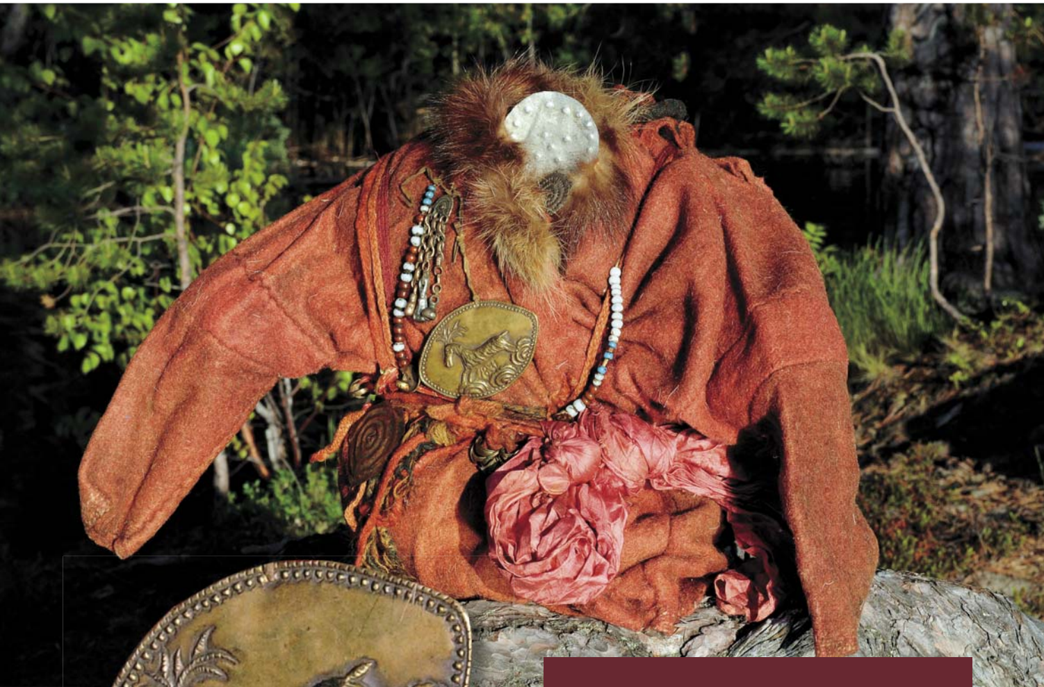
Фигура семейного духа-покровителя манси с овальной пластиной на груди. 2008 г.