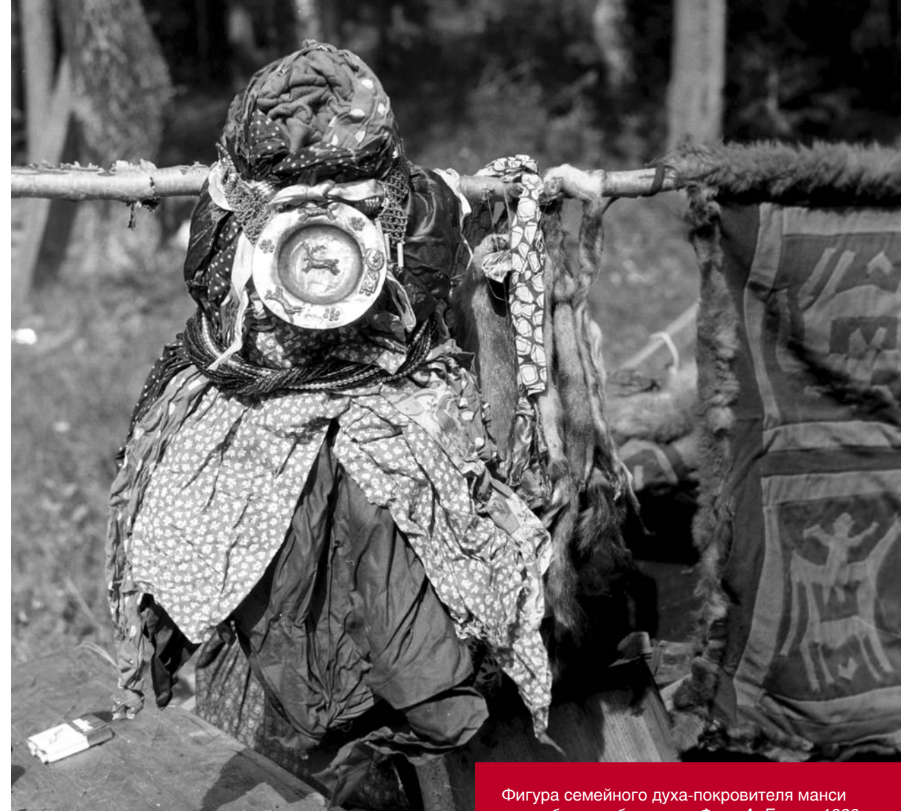
Фигура семейного духа-покровителя манси с серебряным блюдцем. Фото А. Бауло, 1989 г.

Чаще всего с помощью блюдец обозначали лица фигур божеств. Нередко блюдца, принесенные в дар божествам, с течением времени становились сердцевинами их фигур в домашних святилищах, прикрепление серебряного или медного блюдца к фигуре духа-покровителя, изготовленной из шуб, халатов или рубах, подчеркивало его священный образ. В пос. Анжигорт у хантов Елескиных сердцевиной головы семейного духа-покровителя, образованной свернутыми платками, являлось серебряное блюдце с изображением медведя.