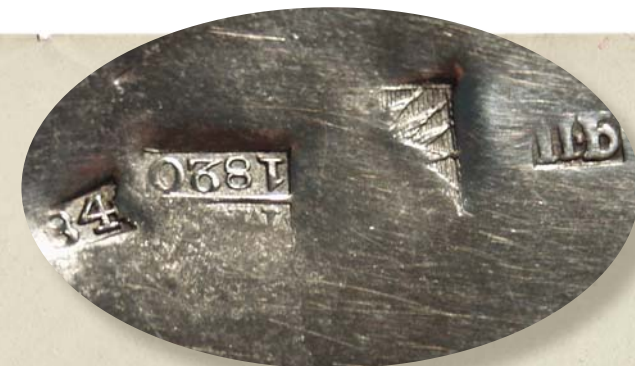
Клейма на блюдце

В XVIII–XIX вв. для всех городов России накладываемые пробирерами клейма состояли из клейма с гербом города или региона в щитках различной формы, клейма с начальными буквами имени и фамилии («именником») пробирного мастера с указанием года или без него, всегда в прямоугольном щитке, клейма с двумя цифрами, обозначающими пробу серебра. Мастера, мастерские и фабрики обязаны были ставить свои клейма-именники до предъявления изделий государственному пробиреру. Клейма с двумя или тремя начальными буквами имени и фамилии мастера помещались в щитках разнообразной формы с различным начертанием букв.