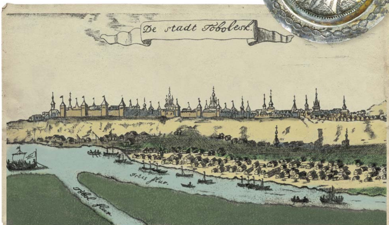
Тобольск. Гравюра XVII в.

Становление серебряного ремесла в Тобольске