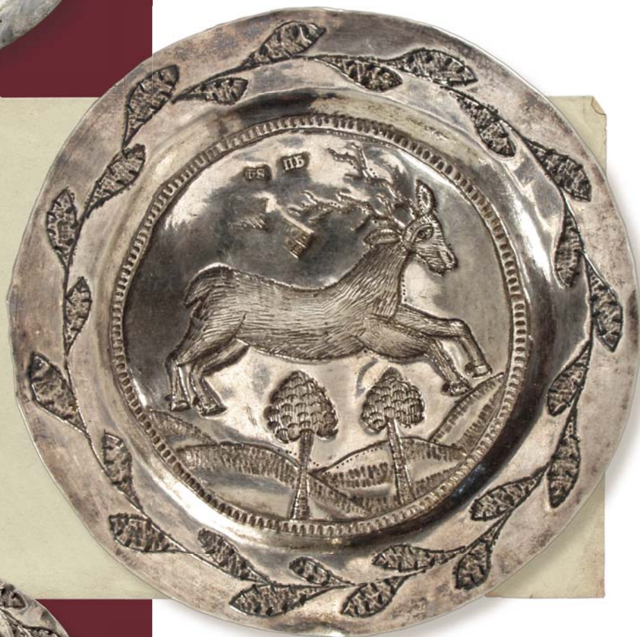
Блюдце с изображением оленя. Тобольск, первая четверть XIX вв. Серебро. Диаметр 10,6 см. Клейма мастера: П-Б

Известно, что после 1711 г. в Тобольск были присланы пленные шведы. Некоторые офицеры занимались серебряным производством, один из них в молодости обучался этому ремеслу. Он устроил большую мастерскую,