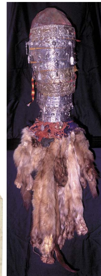
Фигура Казымской богини

«Иноверцы Березовской округи» (1783 г.) «болванов имеют деревянных из обрубка лесины разной величины..., а рожи приделывают высеченные на тонком железе...» [Андреев, 1947, с. 96].