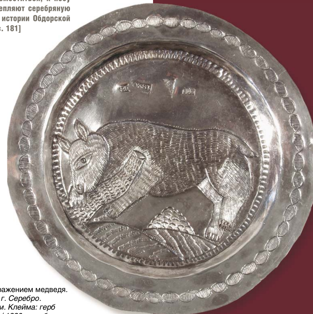
Блюдец с изображением медведя. Тобольск, 1820 г. Серебро. Диаметр 10,4 см. Клейма: герб Тобольска; М... / 1820 – пробирера М. Богданова; П-Б; 84 проба. Музей ИАЭТ СО РАН

В рапорте священника И. Голошубина от 6 июля 1891 г. описан обряд при добыче медведя: «Содранную с него шкуру кладут на стол в переднем углу, расправляют у него ноги и голову; на каждый из когтей надевают столько колец, сколько их может поместиться; к носу медведя прикрепляют серебряную тарелку...» [Из истории Обдорской миссии, 2004, с. 181]