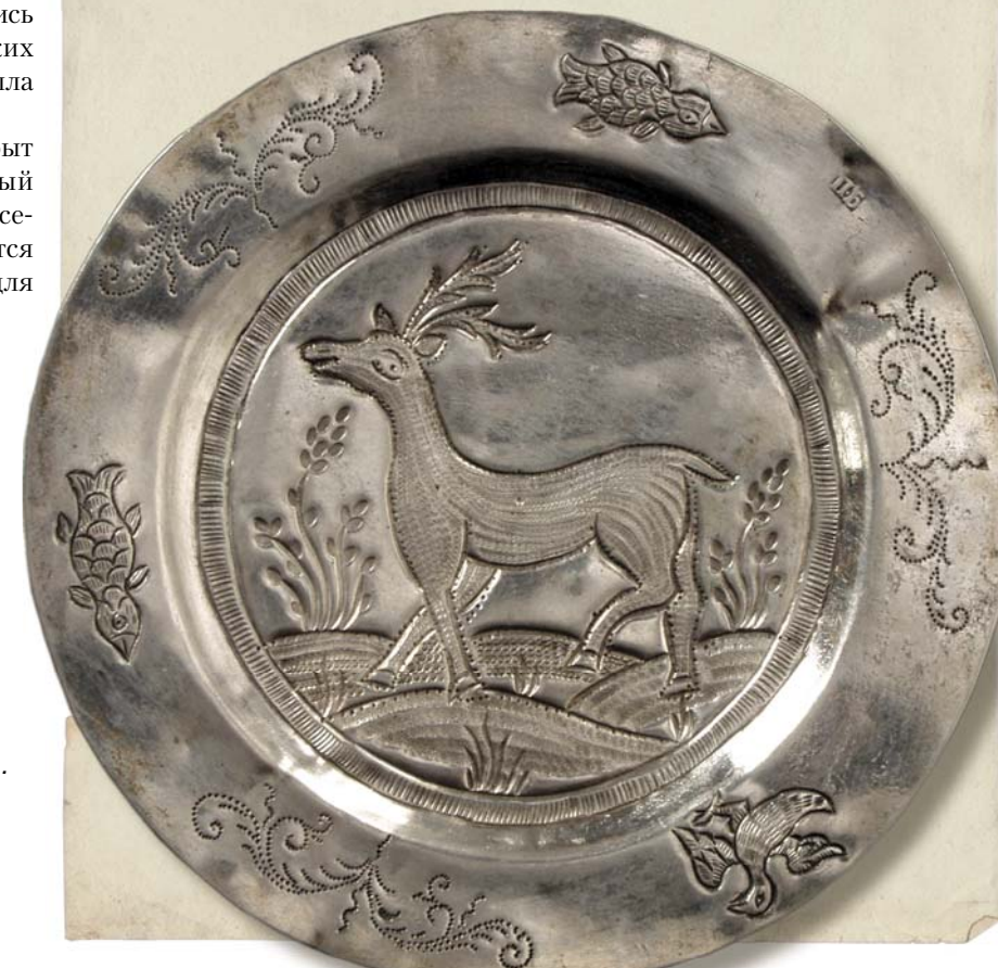
Блюдце с изображением оленя. Тобольск, первая четверть XIX в. Серебро. Диаметр 11,5 см. Клейма мастера: П-Б. Музей ИАЭТ СО РАН